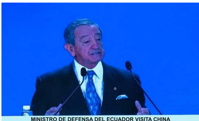
MINISTRO DE DEFENSA DEL ECUADOR VISITA CHINA