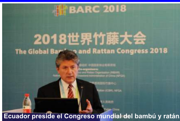
Ecuador preside el Congreso mundial del bambú y ratán.