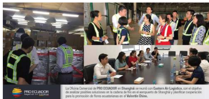
INSTITUTO DE PROMOCIÓN DE EXPORTACIONES E INVERSIONES

E l 27 de julio de 2018, la Oficina Comercial del Ecuador en Shanghai, se reunió con la empresa EASTERN AIR LOGISTICS, con el objetivo de analizar posibles soluciones en la cadena de frío en el aeropuerto de Shanghai y buscar mecanismos de cooperación para la promoción de flores ecuatorianas en el día del San Valentín chino.